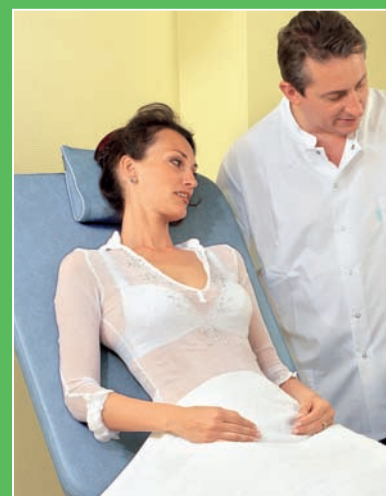
Le dialogue thérapeute-patient prépare à l'exercice de biofeedback

Antalgique / analgésique Excitomotrice / renforcement musculaire