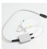
Manomètre 1 ou 2 voies